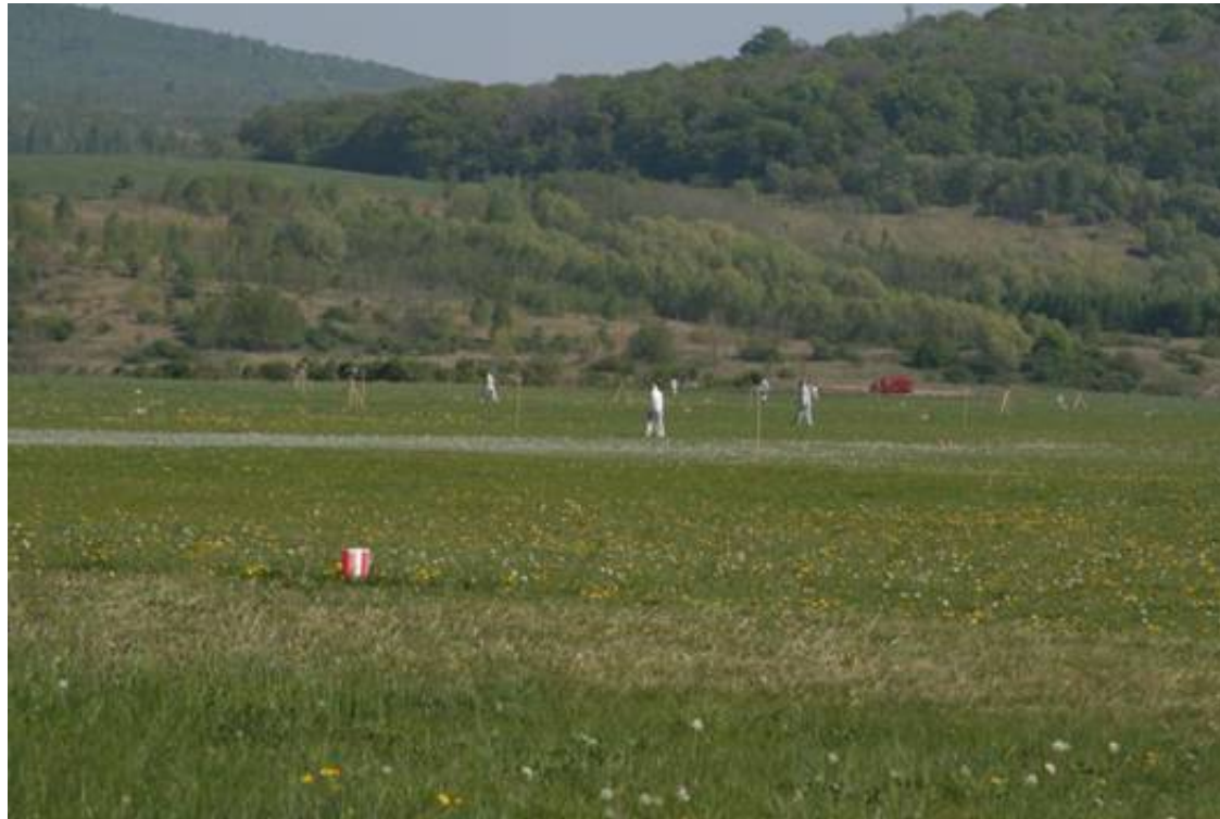
Obrázek 21: Plošné uzavírání pasivních detektorů; Autor: David Šátek.