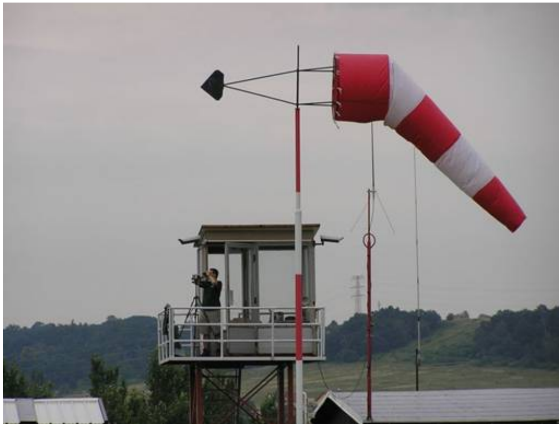
Obrázek 20: Pohled na řídicí stanoviště

Každý test byl zakončen uzavřením pasivních detektorů, které muselo proběhnout rychle, aby byla minimalizována kontaminace detektorů pozadovým prachem. K uzavírání však mohlo být přistoupeno až v okamžiku, kdy oblak aerosolu vzniklý výbuchem přešel přes celý polygon, anebo pokud došlo k jeho výstupu. Tento okamžik bylo nutné stanovit vizuálním pozorováním z řídicí věže (viz obrázek 20) odkud byl postup oblaku monitorován. Pomocí smlouveného signálu byl následně vydán pokyn k uzavírání detektorů plastovými víčky (viz obrázek 21). Po vyklizení polygonu byly exponované detektory sejmuty z tyčí, rozříděny a odeslány k vyhodnocení (viz obrázek 22).