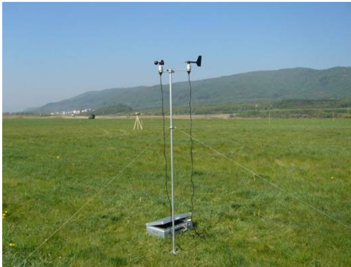
Obrázek 14: Mobilní automatická meteorologická stanice; Autor: Tomáš Vítek.

Pro určení směru větru na celé ploše polygonu byly používány výstražné fábory, které byly umístěny na všech tyčích hlavní (středové) linie (viz obrázek 15) a na okrajových tyčích v každé řadě. Tyto směrové ukazatele sloužily především pro stanovení okamžiku výbuchu, který bylo nutné stanovit ad hoc podle aktuální povětrnostní situace. Bylo-li větrné pole na celé ploše polygonu ustálené, pak bylo možno vydat pokyn k odpalu.