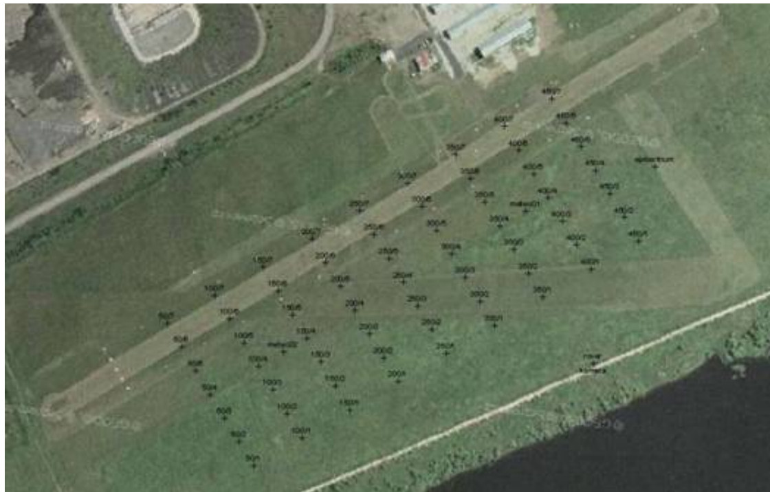
Obrázek 12: Vizualizace tvaru detekční sítě a rozmístění jednotlivých terčů, meteorologických stanic a epicentra výbuchu; Autor: Slavoj Zemánek.