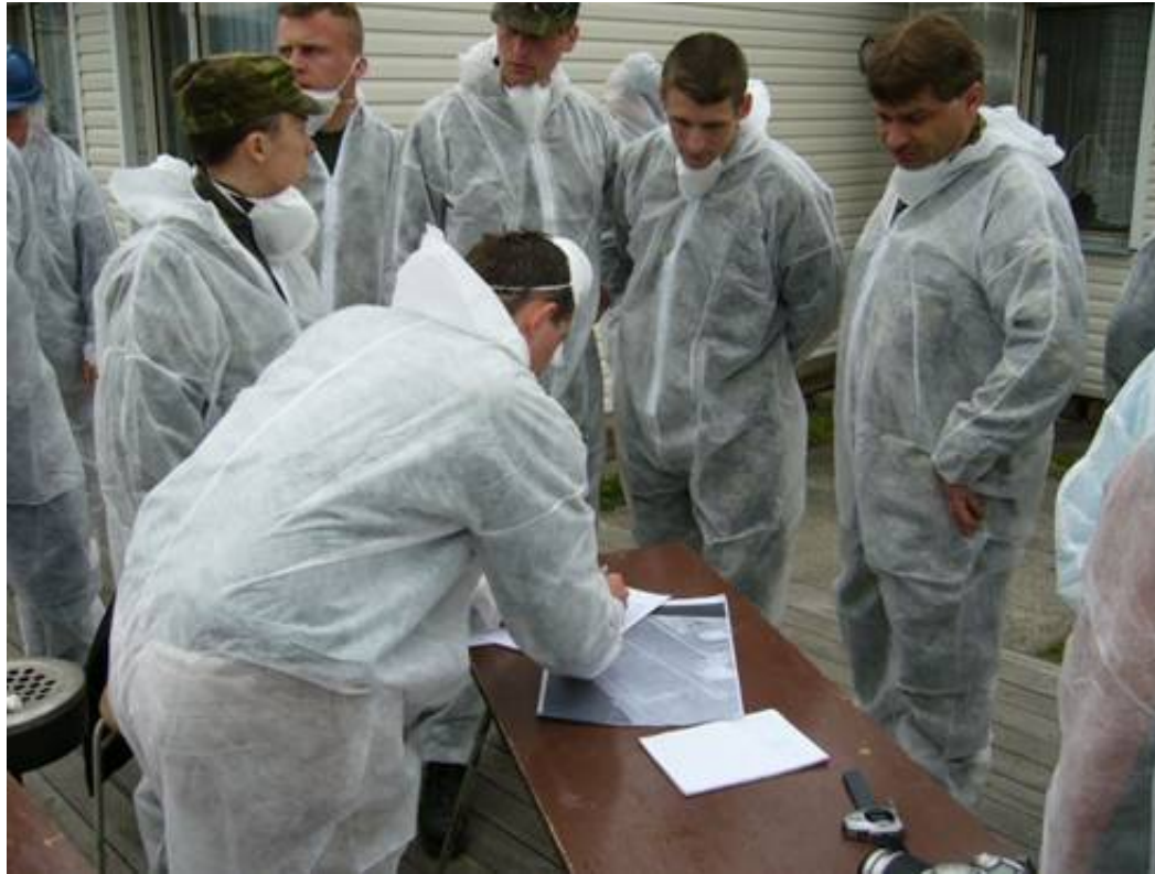
Obrázek 19: Pracovní porada členů týmu před zahájením testů; Autor: Tomáš Vítek.