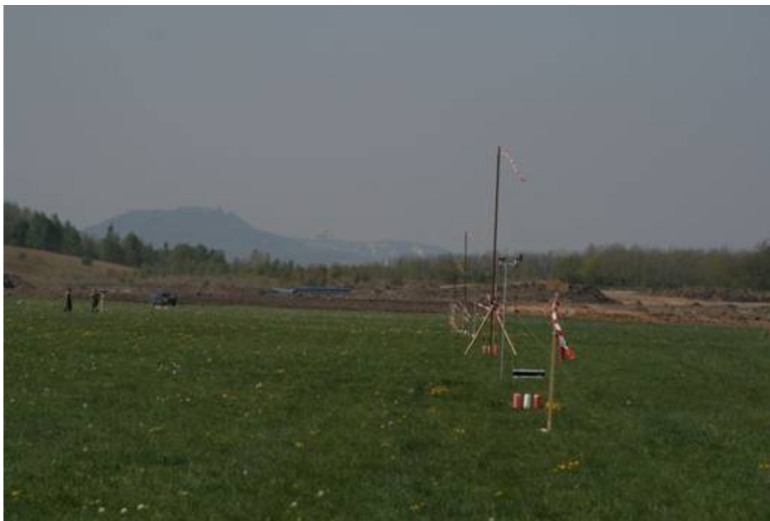
Obrázek 15: Pohled na hlavní linii s rozmístěnými tyčemi s fábory a automatickou meteorologickou stanicí