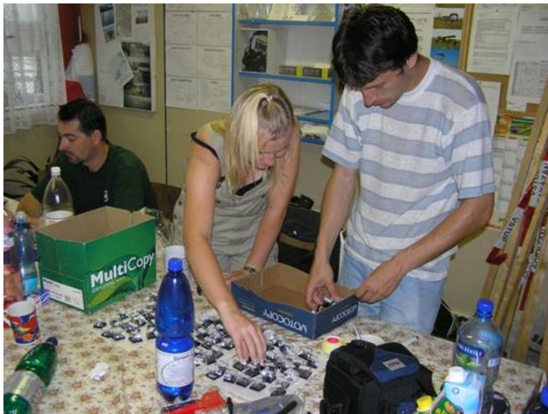
Obrázek 22: Inventarizace a třídění sebraných pasivních detektorů

Pokračování v příštím čísle časopisu JOSRA.