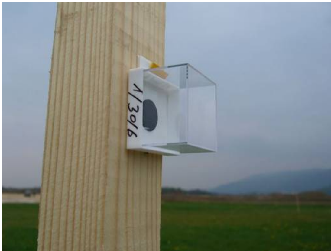
Obrázek 11: Pohled na pasivní detektor (detektor je po sejmutí plastového víčka připraven k expozici); Autor: Tomáš Vítek.