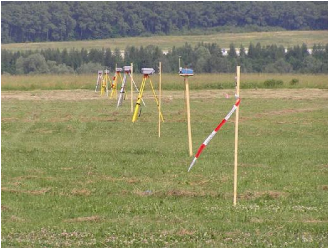
Obrázek 13: Rozmístění aktivních detektorů DustTrak; Autor: Petr Skřehot.