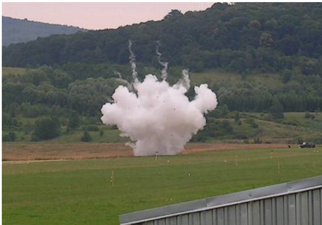
Obrázek 16a, 16b: Tvary oblaků cca 1 sekundu po výbuchu při použití různých výbušnin; Autor: Petr Skřehot.