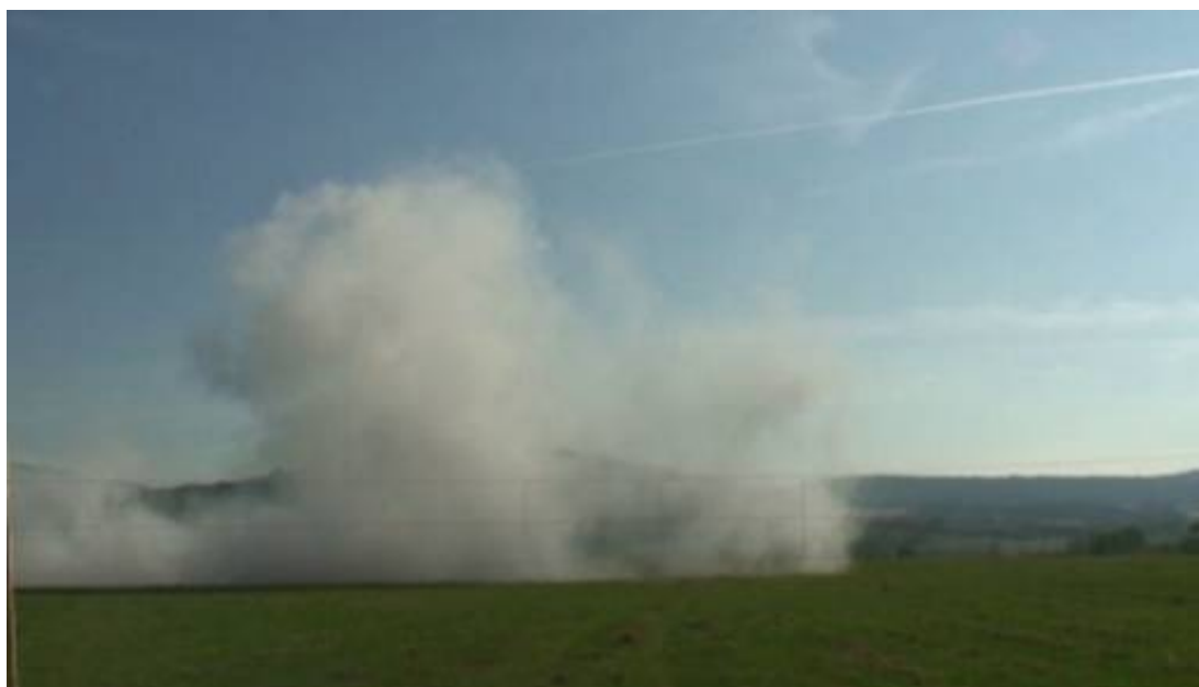
Obrázek 18: Reálná podoba zaměřovací sítě na výstupu z videozáznamu; Autor: Slavoj Zemánek.